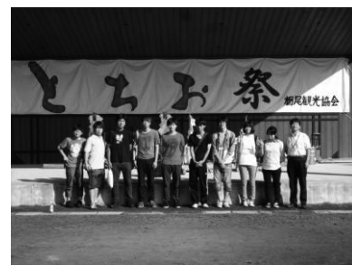
今瀬ゼミ生とボランティア学生 （「とちお祭」メイン会場にて）

また、2014年度の「第60回とちお祭」の「裏方」スタッフと「表方」参加者としての現場活動を通じて、その実態を調査し、提言や情報発信等を行った（後述）。