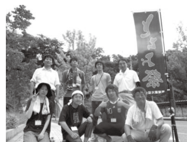
裏方作業後の集合写真 (今瀬ゼミ生と栃尾のスタッフ)

今瀬ゼミの取組みでは、白紙の状態からゼミ生が企画を立て、市役所や地域の団体、住民の方々との関係を一から作り上げていった。ゼミ活動の開始当初は、ゼミ生たちが地域の方々に、地域活性化に協力させてもらえるように一方的にお願いする関係であった。そして、始めて出会う関係であったため、双方の間には当初、どこかぎこちない空気もあった。だが、不備がありながらも、少しずつ協力させていただき、実績を積み重ねていく中で、徐々に互いの信頼関係が生まれていった。そして、ある頃からは、地域の方からも声をかけて下さるようになり、積極的にゼミ生たちと相互に協力し合ったださるようになっていった。