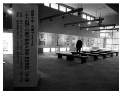
今瀬ゼミ「とちお祭」パネル展

また、今瀬ゼミと長岡市(栃尾支所商工観光課、市民協働推進室)と栃尾観光協会による「協働事業」として、12月～翌2月に、長岡市内で巡回「パネル展」を開催した(道の駅に隣接する「長岡市栃尾産業交流センターおりなす」、長岡駅前にある長岡市役所本庁舎「シティホールプラザ アオーレ長岡」)。パネル展を通じて、栃尾と「とちお祭」の情報発信を行うとともに、事務局スタッフ等しか知らない、とちお祭の「裏方さん」の大変さや面白さ、大事さを地元住民の方々を知ってもらう機会になればと考えた。