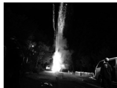
花火が打ちあがる瞬間 (火柱が立っている)