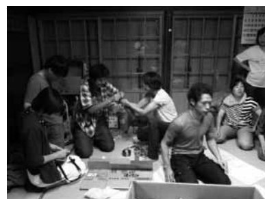
神社境内でポンポン作成

「仁和賀行進」の参加団体（地区）の一つである「栃尾本町区」では、「とちお祭」が近づくと連日のように住民たちが集まって、栃尾中心街の諏訪神社等で準備を進めている。神社の境内には、過去の仁和賀行進で使われていた仮装の衣装、着ぐるみ、小道具などが多数置かれている。それらすべては住民が手作りで作ったもので、その質と量は驚くほどであり、さすが繊維のまちといった印象を受ける。仁和賀行進が毎年行われることで、地区のつながりを豊かに保っている。ただ、他の地区の多くでは、祭りへの参加が減る傾向にあり、栃尾地域の過疎化の課題は大きい。なお、ゼミ生たちは「仁和賀行進」の準備を手伝い、また取材する中で、住民の方々からお声を掛けて頂いて、祭りの「表方」として演技に加わって一緒に躍らせて頂くことになった。