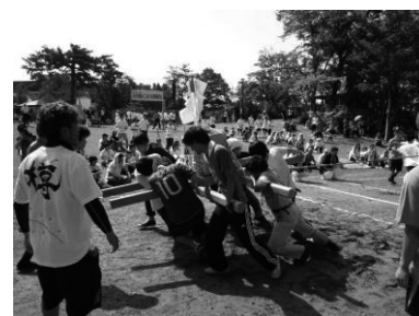
全日本樽みこし綱引き選手権 大会の様子

「仁和賀行進」では、途中から雨が降ったものの、ずぶ濡れになりながら踊り、多くの見物客が見続けて賑わいを見せた。踊る者と見物客が一体となって楽しむ光景は、これからの栃尾地域にとって貴重なものと思われた。