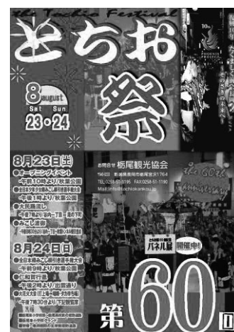
とちお祭のポスター

2日間で様々なイベントが行なわれ、地域を盛り上げたが、その中でも注目されたのが次の3つのイベントである。「全日本樽みこし綱引き選手権大会」は、全国でも珍しい、力自慢の男女が樽の載ったみこしを綱引きする、とちお祭の中でも非常に迫力のあるイベントである。「仁和賀行進」は、町内会ごとの参加団体が、時代を反映し趣向を凝らした山車と踊りでパフォーマンスを行いながら町内を練り歩いて、その特色を競い合う。「大花火大会」は、山の頂上から約5,000発の美しい花火が打上げられ、「とちお祭」と栃尾の夏のフィナーレを飾る。その他、とちお祭の幕開けを告げる「オープニングイベント」や、一日目の夜に行われた、伝統の栃尾甚句が通りを埋めつくす「大民踊流し」や、半纏合わせ必見の「みこし渡御」などがあった。