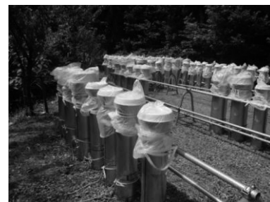
花火を打ち上げる筒 (雨が入らないように洗面器をかけビニールで覆われている)

花火大会は全国で開催されているが、打上げ関連作業の多くを花火業者等に丸投げしている事が少なくない。だが、栃尾地域では住民たちが「栃尾煙火協会」を結成して、花火師しかできない筒の設置・回収や点火等以外のすべての打上げ関連作業を毎年、住民が手作りで行っている(栃尾に花火業者はない)。その一連の作業は毎年、住民から住民に引き継がれてきたもので、安全を第一に、手際よく、確実にこなすものであった。ただ、現在、花火の担い手がなかなか現れず、後継者への引継ぎが課題となっている。